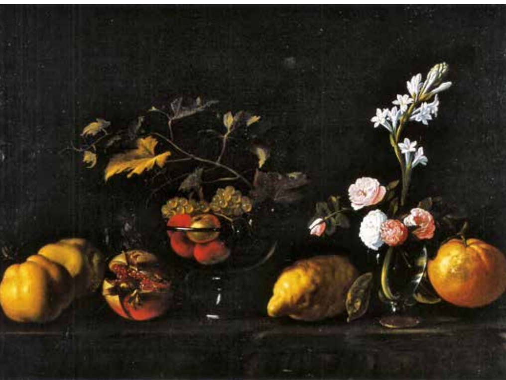
Luca Forte, Still Life with Tuberoses and Crystal Vase . Rome, Galleria Nazionale di Palazzo Corsini

In 1631 Forte was a witness to the signing of a notarial deed regarding Filippo Vitale, a painter similar in culture to Ribera. In 1639 he stood as witness at the wedding of another Neapolitan artist, also close to the circle of the mature Ribera, Aniello Falcone (who was aged thirty-two). These documents implicitly suggest evidence for chronology, since witnesses were usually contemporaries