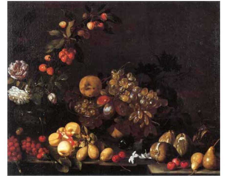
Luca Forte, Still Life . Marano di Castenaso, Molinari Pradelli collection

We have been discussing a master justly included by well-established scholarly tradition among the followers