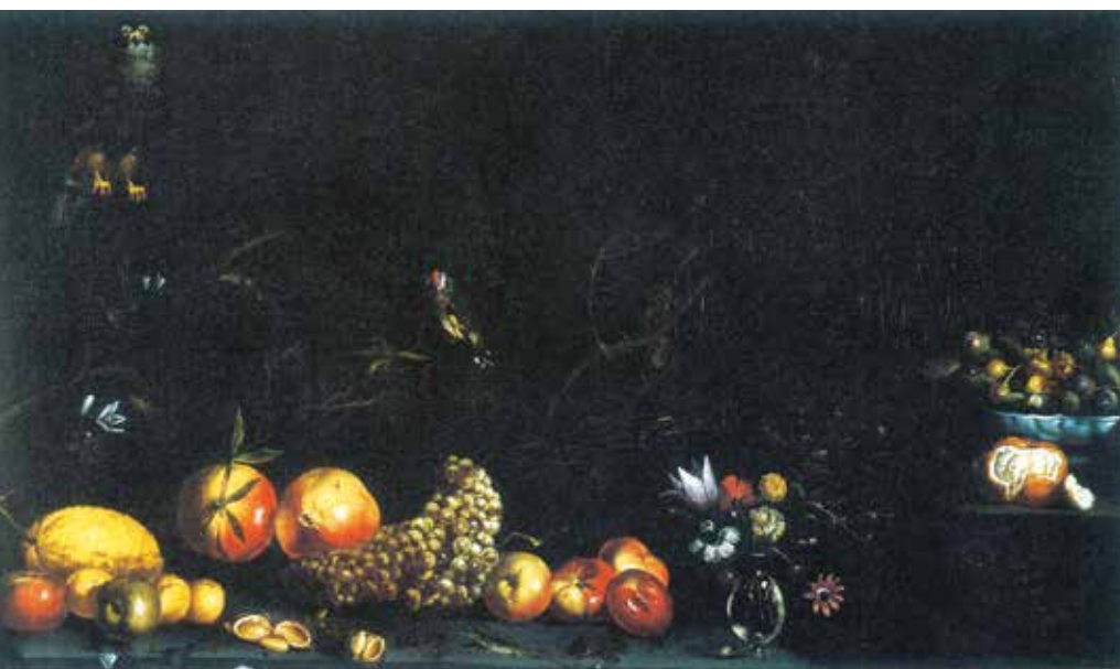
Luca Forte, Still Life with Fruit and Birds . Turin, Galleria Sabauda, study collection

agreement, and one of the principal living experts on still life gives it to a Roman painter active in the first third of the Seicento. 8 Twenty years ago, the present author attempted to reconsider its attribution in a minor section of a monograph on the Neapolitan painter Battistello Caracciolo (1578-1635; another caravaggesco ) – an appropriate place, it seems to us, for reconsidering the credentials of a composition datable to the early 1640s. 9 Whether or not the Turin canvas was painted by Forte, its relationship with ours merits very close attention. In both cases everything pushes towards what we could define as adherence to Caravaggio; or at least the enduring thrust of naturalism.