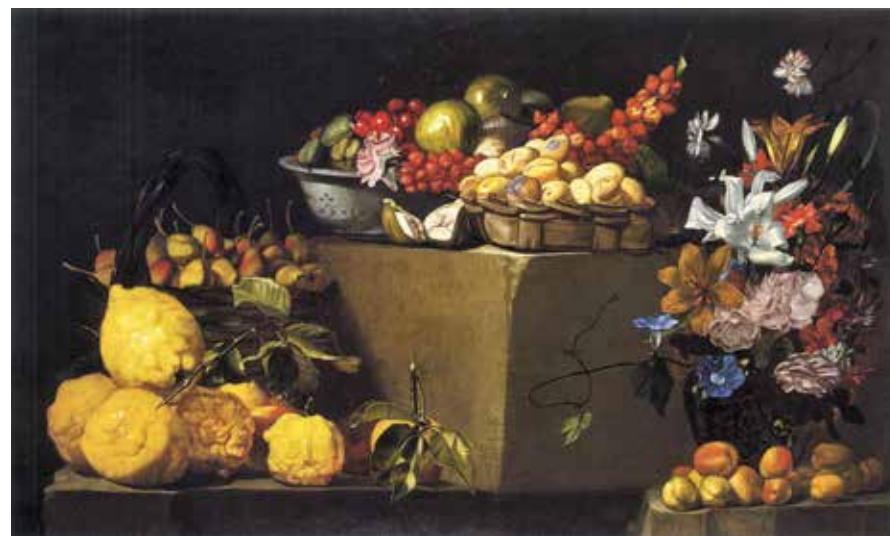
Luca Forte, Still Life with Fruit and Flowers . Private collection

In conclusion, the presence of birds is far from rare in Forte's oeuvre, or in works ascribed to him: I am thinking here of the two octagons in the d'Avalos collection, the Vase with White Grapes and the Vase with Red Grapes , which include parrots and partridges, and where one can sense the mature period of Giacomo Recco (who had died by 1653). 11 In the 1717 inventory of the Prince of Scilla, various paintings with fruit are listed under Forte's name, but there are others with a hen, quails and other birds. Forte was also active as a flower painter, and this side of his output has recently been given proper and focused attention. 12