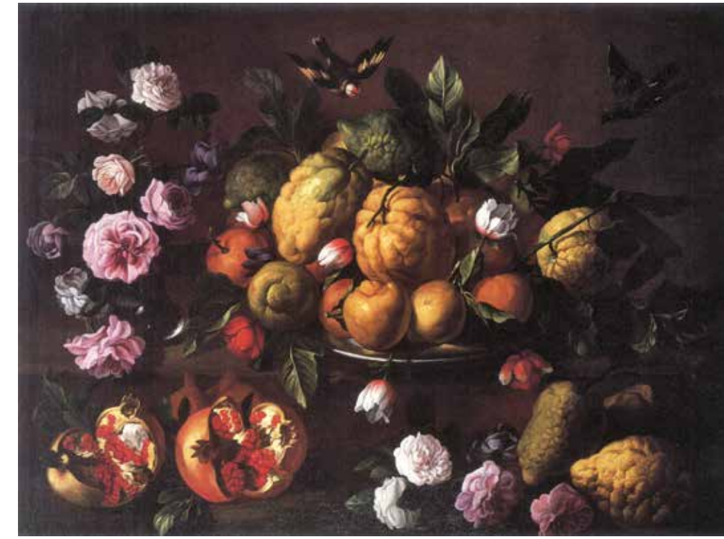
Luca Forte, Still Life with Roses, Anemones and Birds . Formerly London, Matthiesen Fine Art Ltd.

To narrow down the authorship of this fruit stand, one's memory turns to the Still Life with Roses, Anemones and Birds which appeared on the British art market