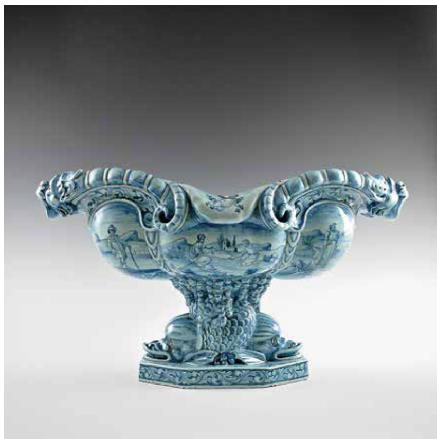
[14] Ulisse Cantagalli Vaso con decoro Iznik fine del sec. XIX, post 1878 Firenze, Maioliche Artistiche Cantagalli Maiolica decorata a smalti policromi sottovetrina, h cm 58, ø cm 56 Sotto la base, in blu, gallo stilizzato e "28"