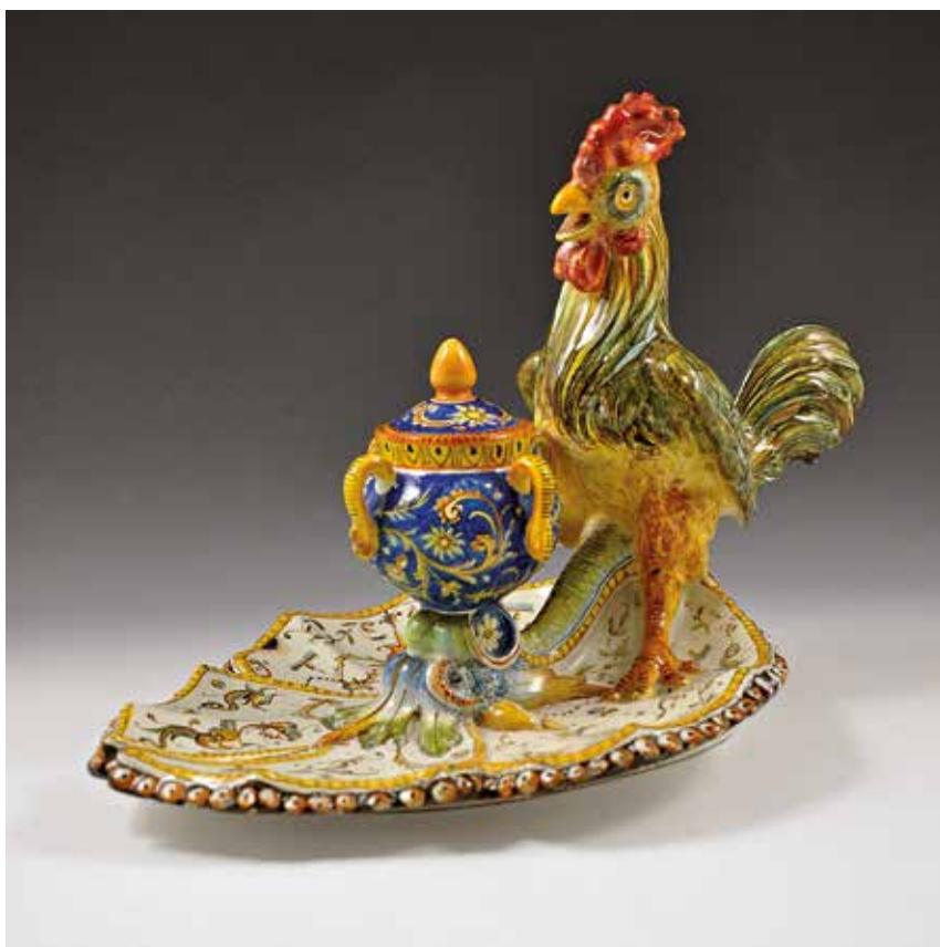
[12] Ulisse Cantagalli Calamaio con gallo fine del sec. XIX, post 1878 Firenze, Maioliche Artistiche Cantagalli Maiolica decorata a smalti policromi sottovetrina, cm 24 x 23 x 35 Sotto la base, in marrone, gallo stilizzato e "6"