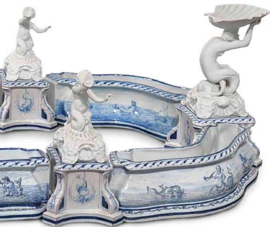
[11] Surtout de table seconda metà del sec. XIX Doccia (Firenze), Ginori Maiolica decorata a smalti policromi sottovetrina e biscuit, cm 95 x 65 x 50 Sotto la base, in blu, "Ginori" coronato e "700"