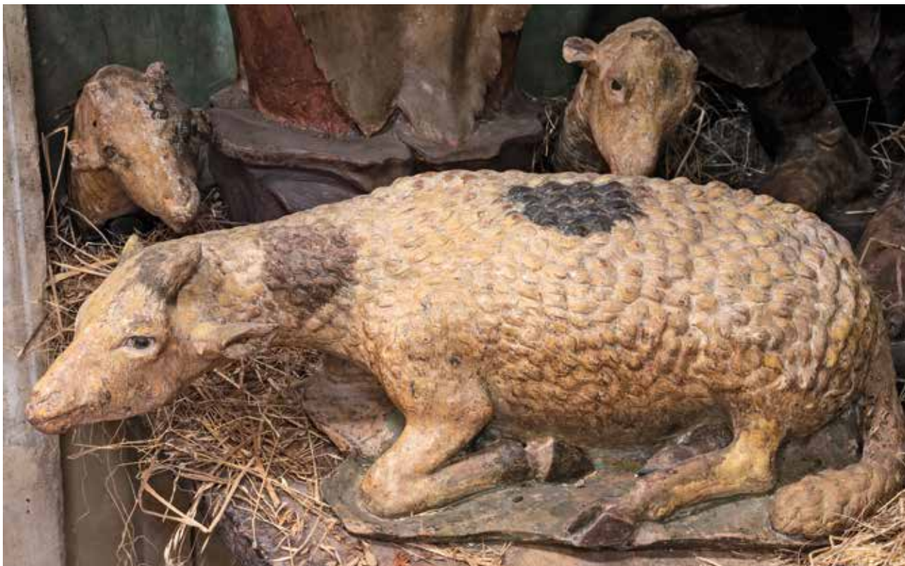
22. Fra Ambrogio della Robbia, Presepe , 1504, particolare, Siena, Santo Spirito

della vita; di particolare bellezza è il viso di un Pastore con lo sguardo verso il cielo (fig. 21), che evidentemente occupava una posizione diversa dall'attuale, forse in dialogo con un gruppo di angeli, splendido nel suo 'rustico' classicismo, come del resto lo è il Suonatore di zampogna (fig. 34), caratterizzato da una fisionomia leonardesca, elegante nella posa e nell'espressione dei gesti nonostante indossi un abito sdruccio.