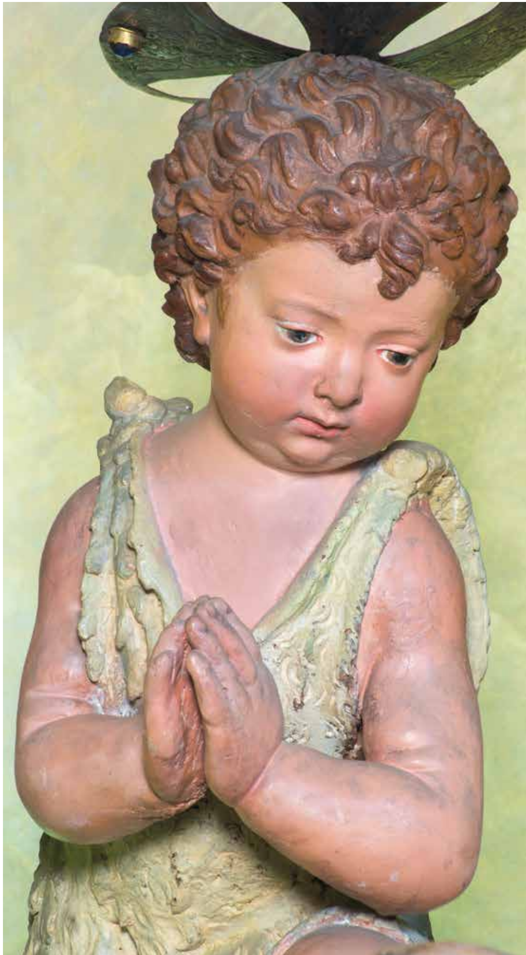
11. Giovanni della Robbia, Presepe , 1510/1520 ca., particolare del San Giovannino , Firenze, chiesa di San Marco