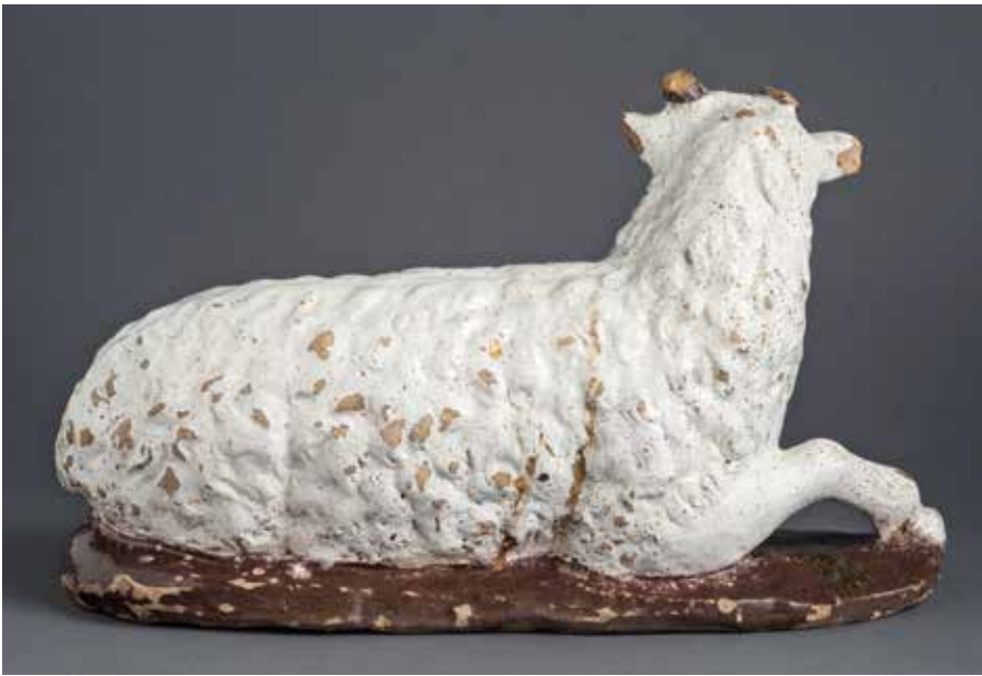
26-27. Giovanni della Robbia, Pecorella , (da un Presepe ), 1520 ca., Firenze, collezione privata