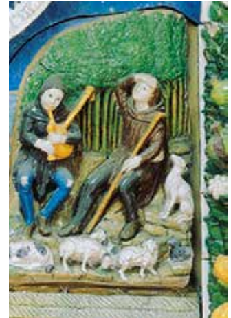
32. Giovanni della Robbia, Presepe con Dio-Padre e lo Spirito Santo , 1520, Firenze, Museo Nazionale del Bargello, proveniente dalla chiesa di San Girolamo delle Poverine, particolare