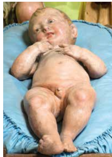
7. Giovanni della Robbia, Presepe , 1510/1520 ca. Firenze, chiesa di San Marco, particolare

da collocare «sotto el pergamo dell'organo», modellate da Giuliano da Maiano nel 1467 per la Collegiata di San Gimignano 6 ; Botticelli dipinse tra il 1496 ed il '97 la maschera funeraria di Pier Capponi gettata da Benedetto da Maiano, probabilmente in gesso 7 . Lo stesso Benedetto, in virtù dei suoi stretti rapporti di amicizia con Cosimo Rosselli, è probabile ricorresse a questo pittore per colorire le sue opere modellate e anche quelle intagliate, come i suoi crocifissi, una collaborazione forse proseguita con Leonardo del Tasso, nipote ed erede della bottega maianesca che subentrò nel laboratorio di via de' Servi trovandosi proprio il Rosselli quale esecutore testamentario degli eredi di Benedetto 8 . Sono dunque molteplici le testimonianze della interazione tra scultori e pittori, ai quali solitamente veniva affidata l'esecuzione della policromia e della doratura di una statua o di un rilievo, un aspetto laborioso e fondamentale sul piano espressivo nella percezione dell'opera da parte degli acquirenti. Quanto indicato per la realizzazione della policromia nei lavori in terracotta e stucco è valido anche per il legno dipinto, nel segno dell'unità delle arti espressa nel Quattrocento 9 , a proposito della quale mantiene sempre il suo valore l'acuta osservazione di Ulrich Middeldorf: «Le diverse arti, invece di stare ognuna per se stessa, erano piuttosto espressioni tecniche di uno stesso concetto artistico» 10 .