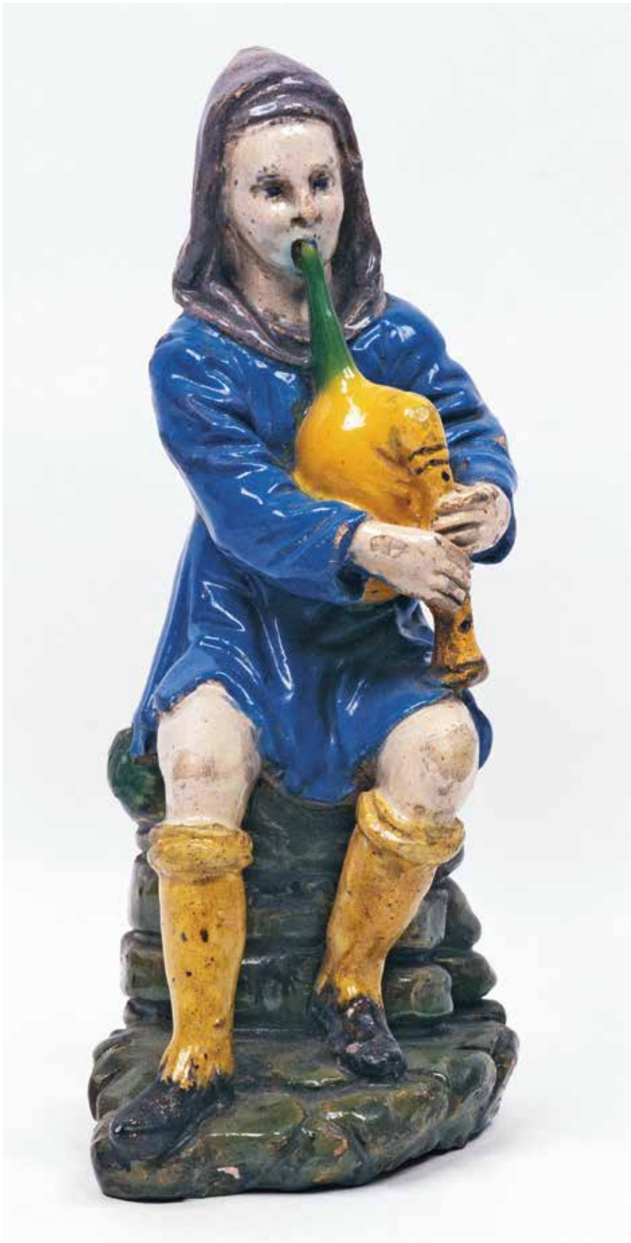
31. Giovanni della Robbia, Pastore con la zampogna , (da un Presepe ), 1520 ca., Écouen, Musée National de la Renaissance