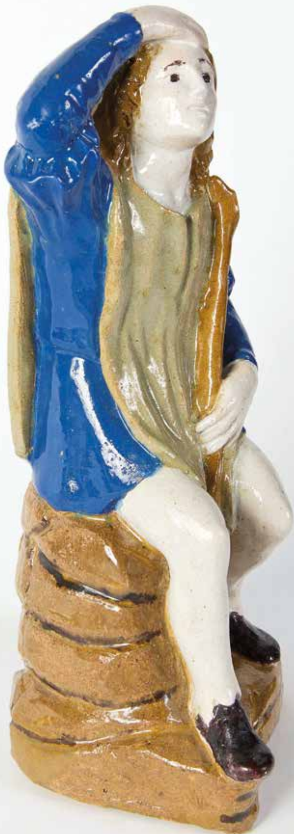
30. Giovanni della Robbia, Pastore che scruta il cielo , (da un Presepe ), 1520 ca., Moulins, Museo Anne-de-Beaujeu & Maison Mantin