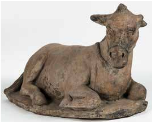
40. Benedetto Buglioni, Presepe , 1510 ca., Firenze, Museo di Santo Stefano al Ponte, già Sant'Andrea a Camoggiano, Barberino di Mugello, particolare con un bue