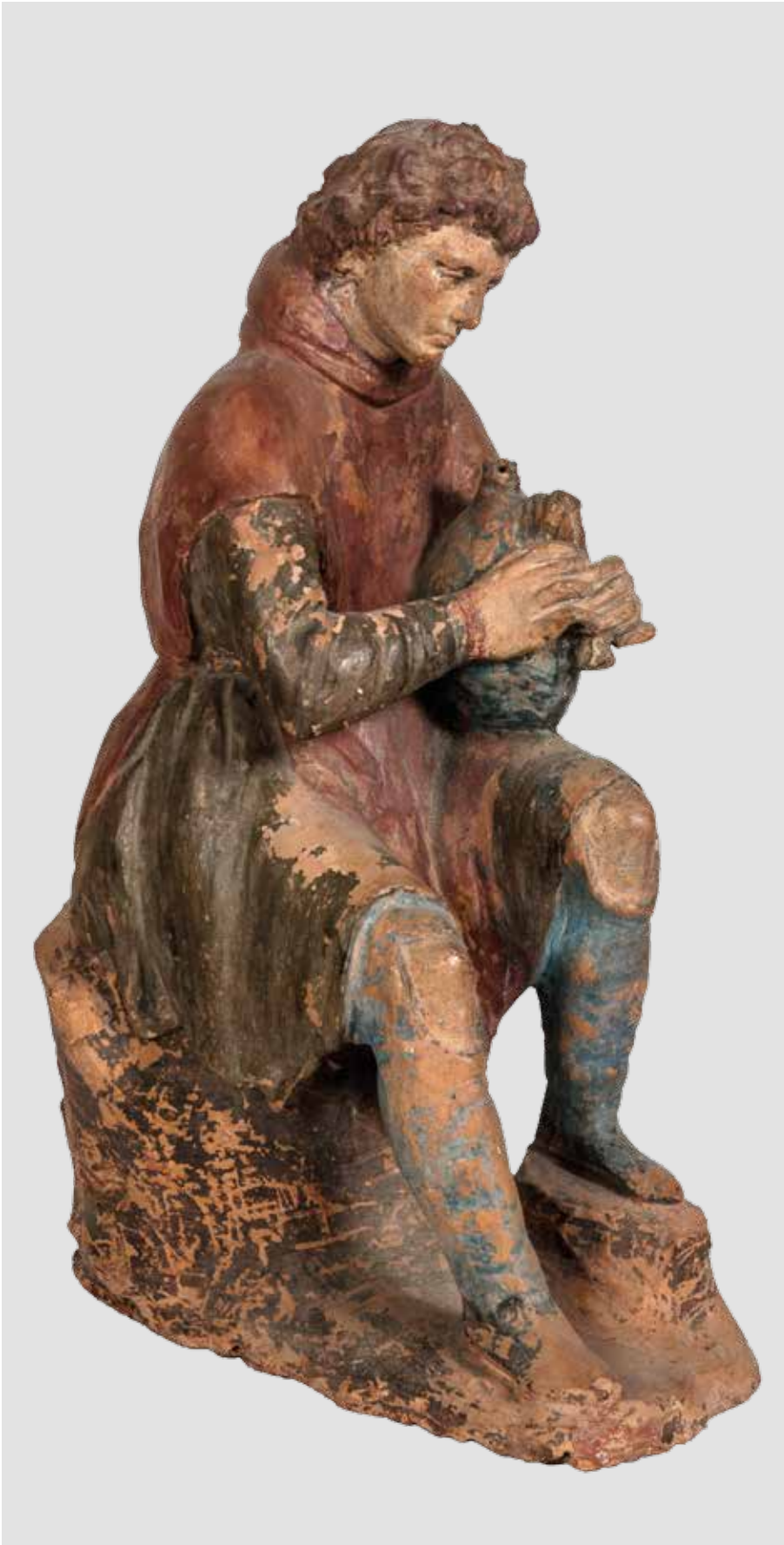
33. Benedetto Buglioni, Presepe , 1510 ca., Firenze, Museo di Santo Stefano al Ponte; proveniente dalla chiesa di Sant'Andrea a Camoggiano, Barberino di Mugello, particolare del Suonatore di zampogna