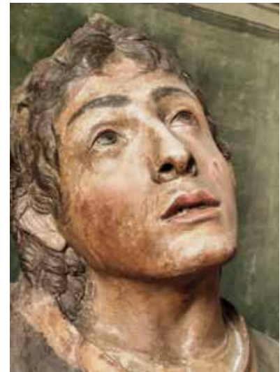
19-21. Fra Ambrogio della Robbia, Presepe , 1504, particolari, Siena, Santo Spirito

dallo spiccato timbro naturalistico, sorta in seno all'umanesimo fiorentino, con i santi che avevano i volti e le vesti delle divinità antiche.