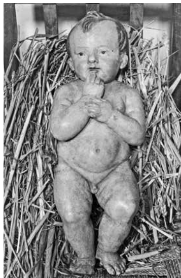
6. Andrea della Robbia, Presepe , 1515, particolare del Gesù bambino , Caldine (Fiesole), Santa Maria Maddalena