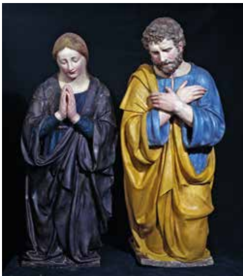
5. Andrea della Robbia, Presepe , 1515, Caldine (Fiesole), Santa Maria Maddalena