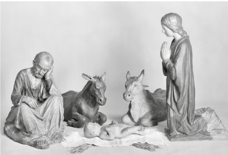
2. Andrea Della Robbia, Presepe , 1474 ca., Volterra, Duomo: particolare con la testa di un bue, Volterra, Museo Diocesano