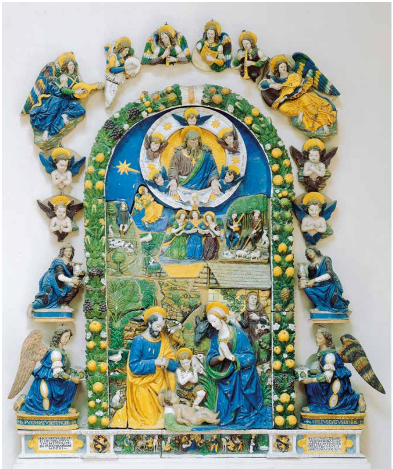
29. Giovanni della Robbia, Presepe con Dio-Padre e lo Spirito Santo , 1521, Firenze, Museo Nazionale del Bargello, proveniente dalla chiesa di San Girolamo delle Poverine