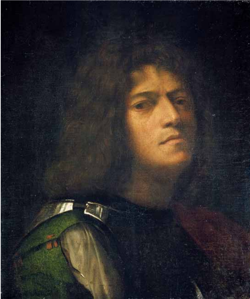
5. GIORGIONE Autoritratto , 1508 circa. Braunschweig, Herzog Anton Ulrich Museum | GIORGIONE, Self-portrait , c. 1508. Braunschweig, Herzog Anton Ulrich Museum