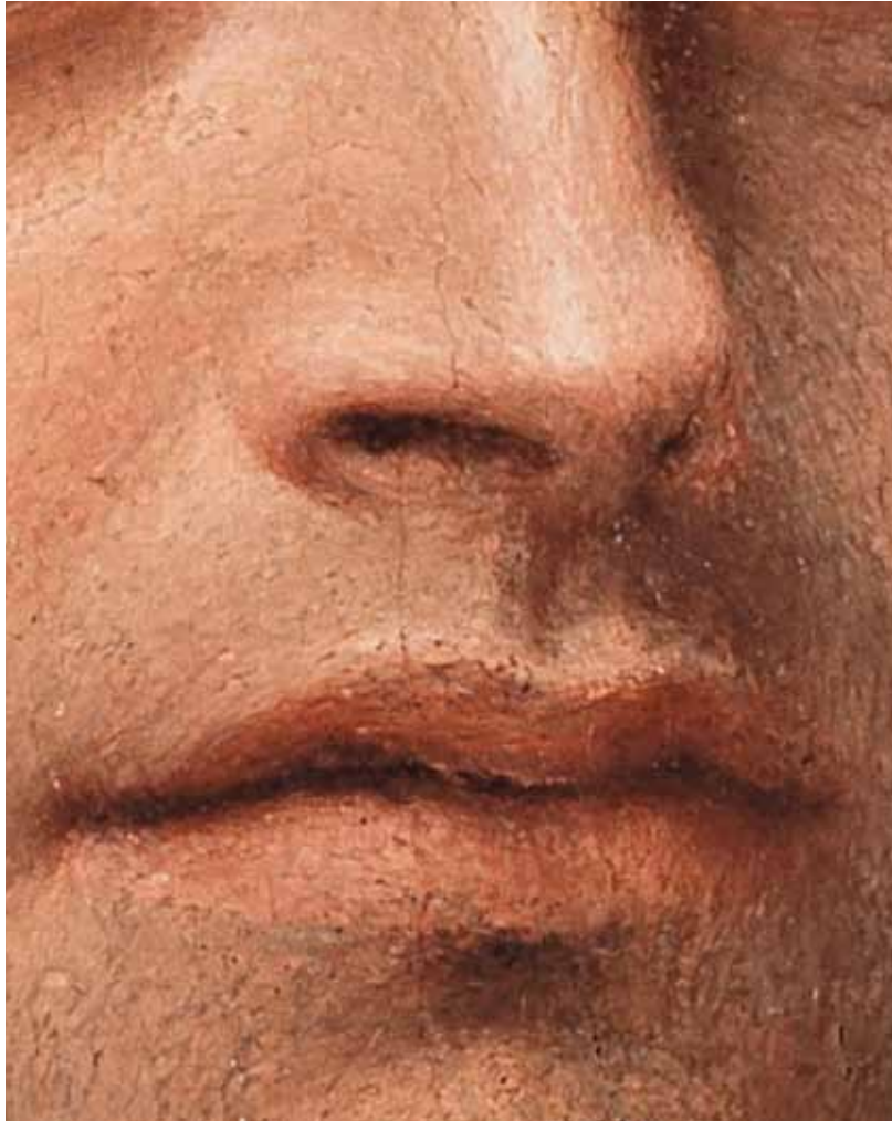
ANTONIO CANOVA, Autoritratto di Giorgione , particolare | ANTONIO CANOVA, Self-portrait of Giorgione , detail