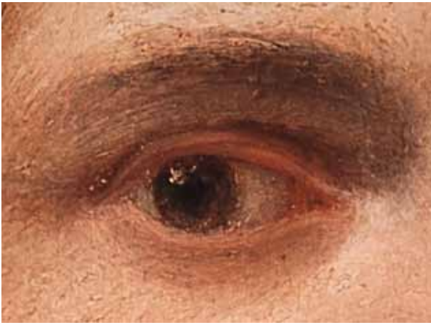
ANTONIO CANOVA, Autoritratto di Giorgione , particolare | ANTONIO CANOVA, Self-portrait of Giorgione , detail