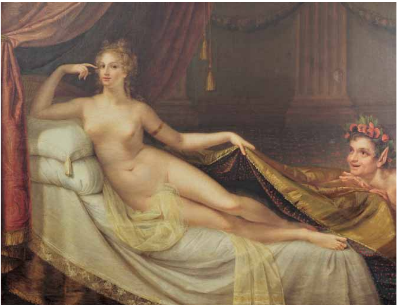
7. ANTONIO CANOVA, Venere con fauno , 1792. Possagno, Gipsoteca e Casa Canova. Per gentile concessione di Fondazione Canova onlus - Gypsotheca e Museo Antonio Canova di Possagno | ANTONIO CANOVA, Venus with a Faun , 1792. Possagno, Gipsoteca and Casa Canova

"was painted in order to hear their impartial judgment. The painter kept silent in connection with that object. The painting consists of a half-figure, life-size, and as I have described it; coloured on a wooden panel. Rome's foremost painters considered it and argued that it was a portrait of Giorgione,