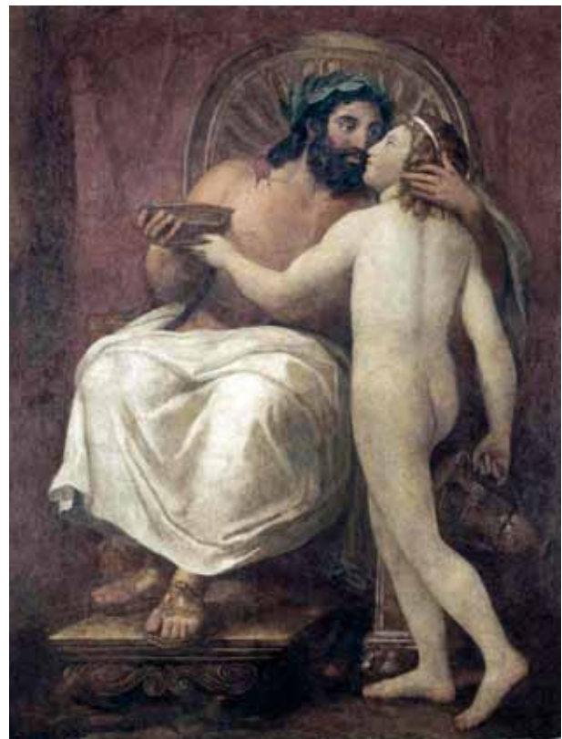
8. ANTON RAPHAEL MENGS, Giove bacia Ganimede , 1760 circa. Roma, Galleria Nazionale d’Arte Antica, Palazzo Barberini | ANTON RAPHAEL MENGS, Jupiter kissing Ganymede , c. 1760. Rome, Galleria Nazionale d’Arte Antica, Palazzo Barberini