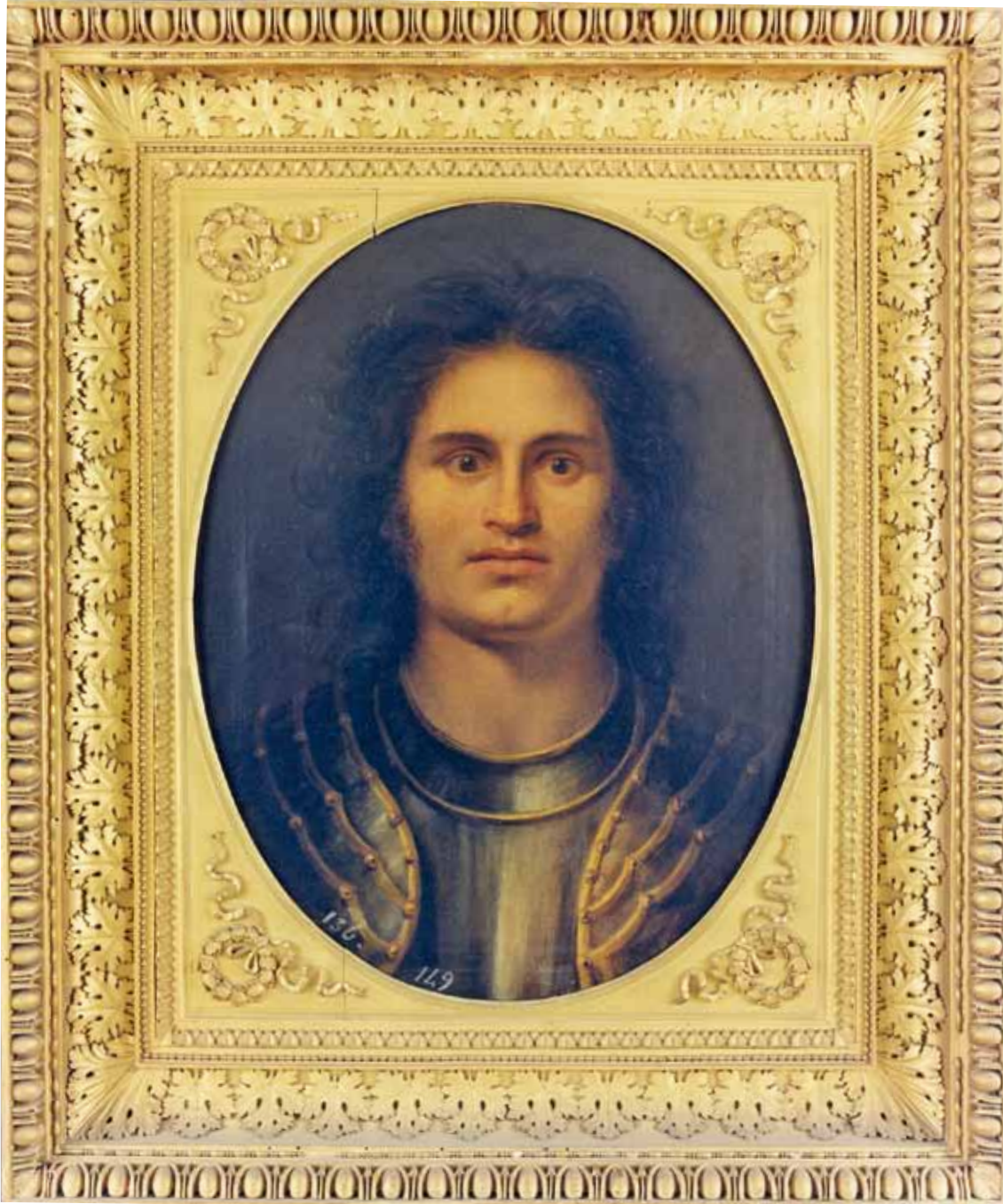
2. ANTONIO CANOVA, Ritratto di guerriero (Ezzelino da Romano) , 1793. Città del Vaticano, Palazzo di Propaganda Fide, Congregazione per l'Evangelizzazione dei Popoli | ANTONIO CANOVA, Portrait of a warrior (Ezzelino da Romano) , 1793. Vatican City, Palazzo di Propaganda Fide, Congregazione per l'Evangelizzazione dei Popoli