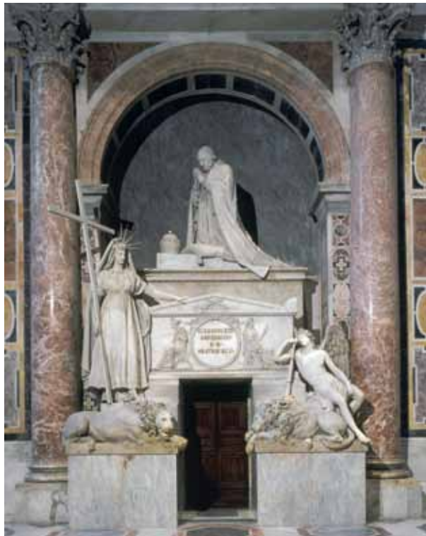
ANTONIO CANOVA, Monumento funerario di Clemente XIII, 1783-1792. Roma, Basilica di San Pietro. | ANTONIO CANOVA, Clement XIII's Tomb, 1783-1792. Rome, St. Peter's Basilica

In the case of the painting under discussion in this essay, an elusive Self-portrait of Giorgione deliberately painted with intent to deceive several of the greatest painters and connoisseurs of the time in the course of an extremely successful practical joke, Canova chose to measure his skill against that of another legend, the controversial and mysterious genius of Castelfranco, one of the great initiators of the “modern manner”, thus shrewdly displaying his talent as a painter at the very moment in which he was achieving renown as the genius tapped by fate to revolutionise sculpture – an art which, after Canova, was never to be the same again.