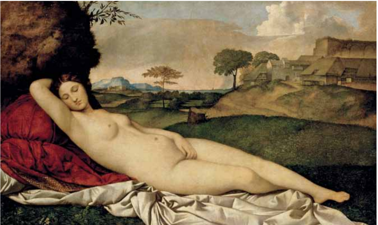
13. GIORGIONE, Venere di Dresda , Gemäldegalerie Alte Meister, Dresda, 1507-1512 | GIORGIONE, Sleeping Venus , Gemäldegalerie Alte Meister, Dresden, 1507-1512