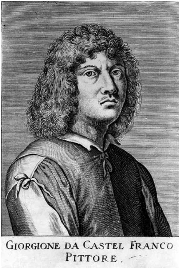
10. Giorgione da Castel Franco pittore , incisione in Carlo Ridolfi, Le meraviglie dell'arte , Venezia 1648 | Giorgione da Castel Franco pittore , engraving in Carlo Ridolfi, Le meraviglie dell'arte , Venice 1648