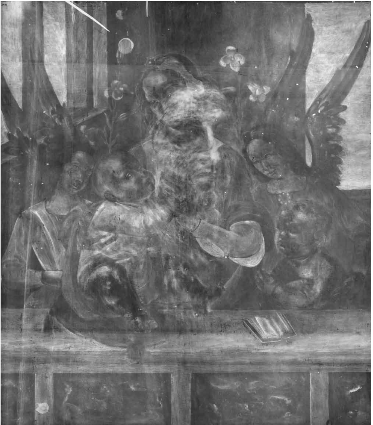
9. ANTONIO CANOVA, Autoritratto di Giorgione , 1792. Fotografia all'infrarosso | ANTONIO CANOVA, Self-portrait of Giorgione , 1792. Infrared photograph