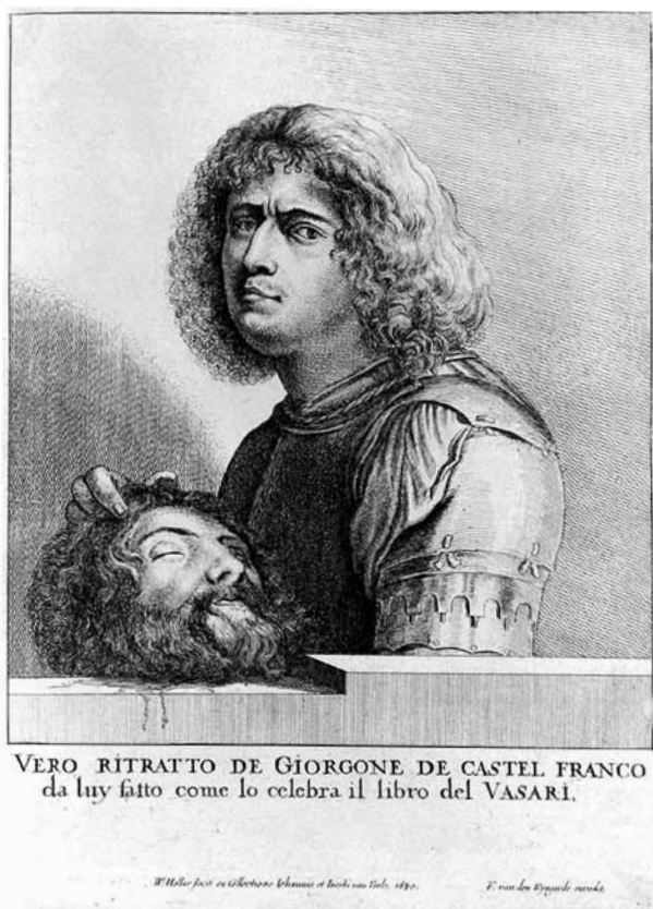
6. WENCESLAUS HOLLAR Vero ritratto di Giorgione de Castel Franco da lui fatto come lo celebra il libro del Vasari , 1650 | WENCESLAUS HOLLAR True portrait of Giorgione de Castel Franco made by himself as celebrated in the book , 1650

Questo ritrovato Autoritratto di Giorgione è un'opera importante e singolare anche perché per la prima volta è menzionato, già con un grande rilievo, in quella che è considerata la prima monografia canoviana Le sculture e le pitture di Canova pubblicate fino a quest'anno 1795 compilata da un appassionato ammiratore di Canova il giovanissimo conte Faustino Tadini 13 ed edita a Venezia nel 1796.