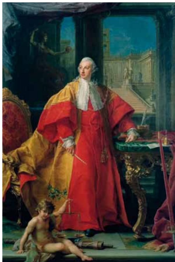
3. POMPEO BATONI, Il principe Abbondio Rezzonico, senatore di Roma , 1766. Roma, Museo di Roma | POMPEO BATONI, Prince Abbondio Rezzonico, senator of Rome , 1766. Rome, Museo di Roma

Following the rediscovery in 2002 of the Portrait of a Warrior painted in 1793 and which Canova entitled Ezzelino da Romano 9 (fig. 2), and of the Half-figure of a boy looking at bird dated 1786, also identified as a Portrait of Prince Henryk Lubomirsky in the guise of the Young St. John the Baptist 10 , both of them works mentioned in the sources, the rediscovery of this Self-portrait of Giorgione marks a decisive contribution to our knowledge of Canova