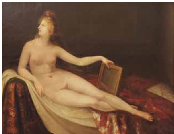
1. ANTONIO CANOVA, Venere con lo specchio , 1787 circa. Possagno, Gipsoteca e Casa Canova. Per gentile concessione di Fondazione Canova onlus - Gypsotheca e Museo Antonio Canova di Possagno | ANTONIO CANOVA, Venus with a mirror , c. 1787, Possagno, Gipsoteca and Casa Canova

Rispetto a questo versante meno noto e un po' eccentrico della produzione canoviana, il maggiore interprete di Canova Leopoldo Cicognara prevedeva che sarebbe stato oggetto dell'interesse degli studiosi come in effetti è avvenuto, anche se poi sono rimaste molte incertezze sulla paternità di opere a lui tradizionalmente attribuite 1 . Nel libro settimo della sua Storia della scultura , uscita in due successive edizioni nel 1813-1818 e nel 1824, quasi