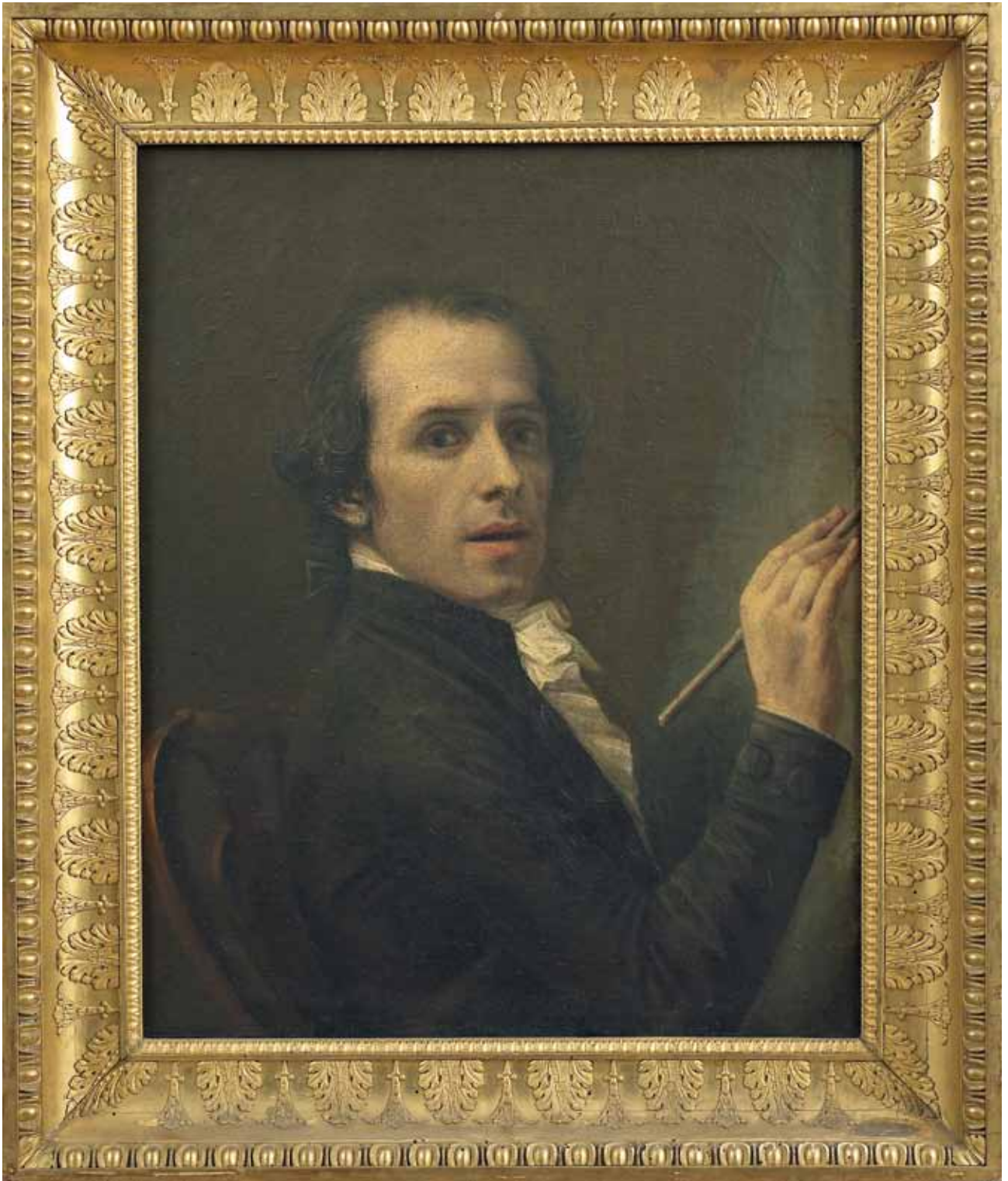
12. ANTONIO CANOVA, Autoritratto, 1792. Firenze, Galleria degli Uffizi. | ANTONIO CANOVA, Self-Portrait, 1792. Florence, Galleria degli Uffizi