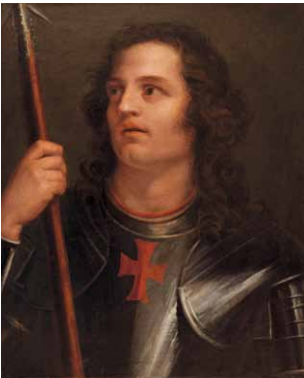
4. ANTONIO CANOVA, Testa di Crociato , 1793. Nantes, Musée des Beaux-Arts | ANTONIO CANOVA, Head of a Crusader , 1793. Nantes, Musée des Beaux-Arts

Cicognara nel citato passaggio della Biografia , alludendo a “qualche testa colorita colla semplice rimembranza del pennello giorgionesco [...] dai più creduta di antico veneziano maestro” si poteva riferire ai dipinti che recano questa impronta e uniti dal destino comune di essere stati dati in dono dallo stesso Canova a personaggi eminenti, come appunto l’ Ezzelino del 1793, regalato al cardinale Ercole Consalvi, uomo colto, amante delle arti ed influente Segretario di Stato del Pontefice Pio VII, la Testa di Crociato (Nantes, Musée des Beaux-Arts) (fig. 4), sempre del 1793, donata a François Cacault, ambasciatore francese a Roma e appunto il nostro Autoritratto di Giorgione . Tra queste tre opere circola come un’aria comune, nell’intento di confrontarsi con Giorgione ed in particolare con un dipinto celebre, ricordato dal Vasari in casa del patriarca Grimani, cioè l’ Autoritratto oggi conservato presso lo Herzog Anton Ulrich Museum di Braunschweig (fig. 5). Opera dall’affascinante storia collezionistica e ben conosciuta attraverso