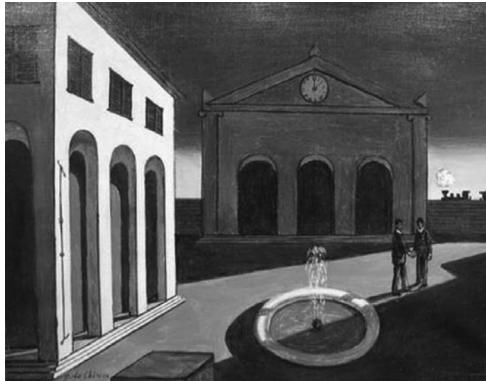
Giorgio de Chirico (1888 – 1978) L'addio dell'amico che parte all'amico che rimane Olio su tela, cm 50x40 Trafugato da un'abitazione privata di Torino nel 1972 Recuperato presso una Galleria d'Arte di Milano nel 2008