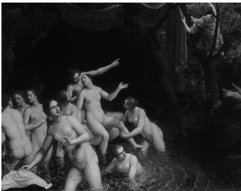
Anonimo del XVII secolo, Diana e Atteone Olio su tela, cm 96x84 Trafugato da un'abitazione privata di Castelraimondo (MC) nel 1981 Recuperato presso una casa d'aste di Milano nel 2008

Di fronte all'attività incessante e disastrosa dei ladri d'arte, ancora una volta ci rallegriamo di poter mettere in luce l'attività meritoria degli uomini del Generale Giovanni Nistri.