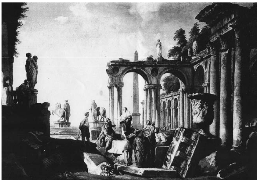
Giovanni Paolo Pannini (1691 – 1765) Veduta architettonica con oratore Olio su tela, cm 86x58 Trafugato da un'abitazione privata di Modena nel 2008 Recuperato presso una Galleria d'Arte di Roma nel 2008