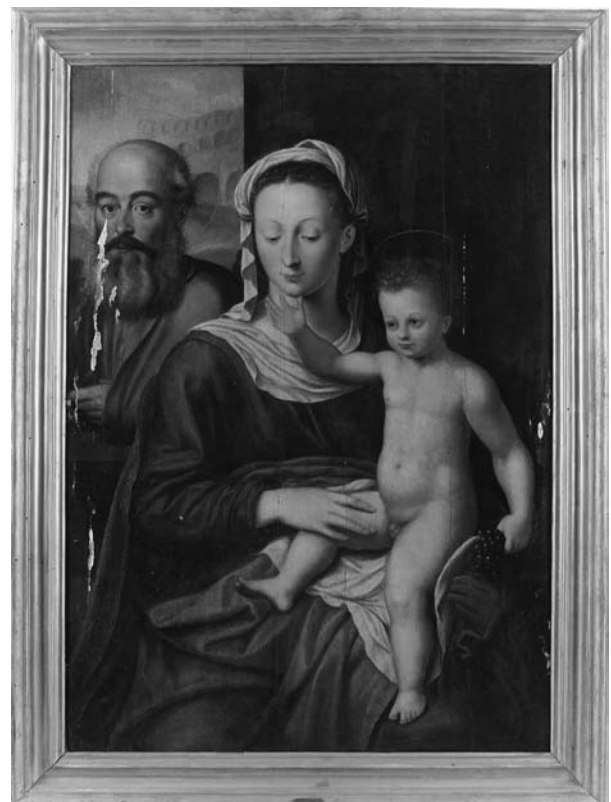
Girolamo Francesco Mazzola detto Parmigianino (1503 -1540), attr., Sacra Famiglia Olio su tavola, cm 82x58 Trafugato dalla sede di un Ente Pubblico di Roma nel 2004 Recuperato presso un'abitazione privata di Roma nel 2008